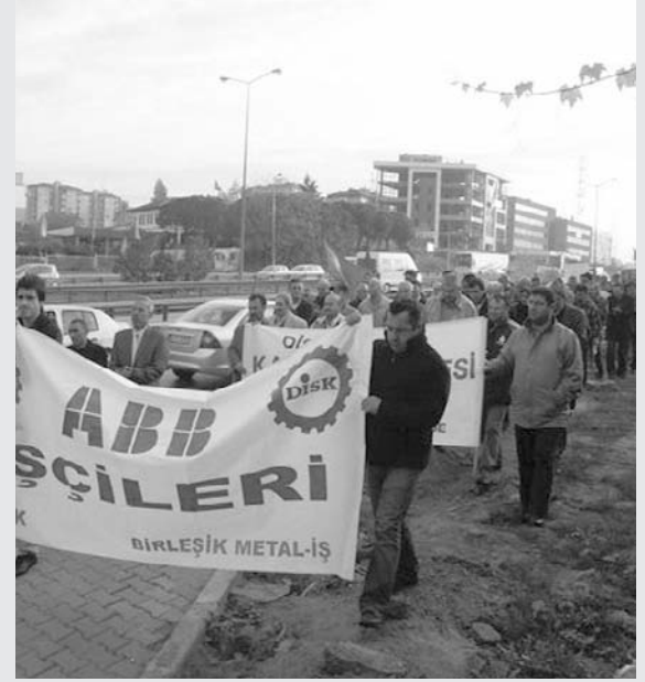
ABB yönetiminden geri adım!

Geçtiğimiz TİS sürecinden sonra, ABB yönetimi işçilere adeta kan kusturmuş, işçiler nezdinde atılan her adıma baskıyla karşılık vermişti. Bu yıl, biri işyeri temsilcisi olmak üzere iki öncü işçiyi göstermelik nedenler öne sürerek işten atmıştı. Ayrıca fabrikanın içine kameralar yerleştirerek, işçiler üzerinde denetim sağlamaya çalışmıştı.