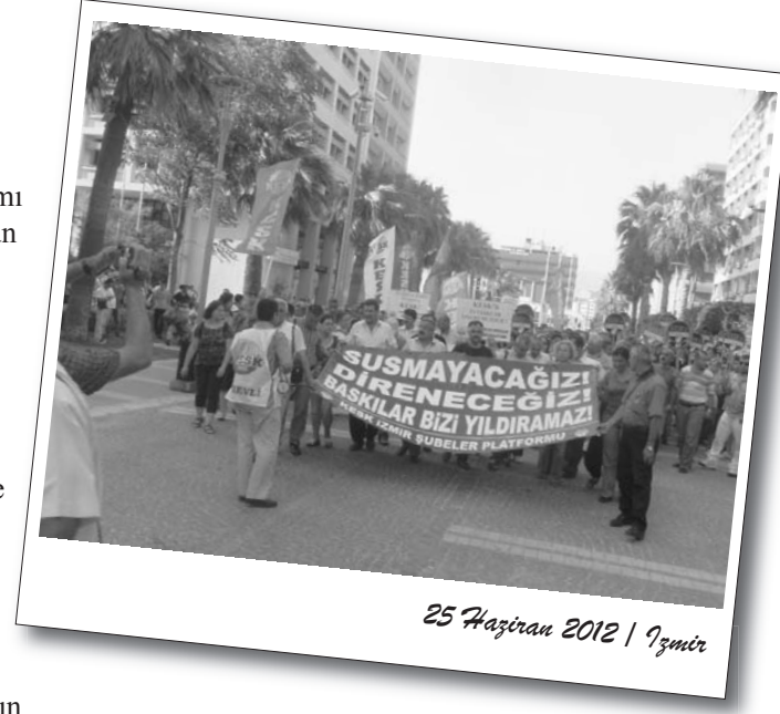
25 Haziran 2012 | İzmir

Eğitim Sen Didim Temsilciliği önünde toplanan emekçiler ellerinde afiş ve dövizlerle yürüyüşe geçti.